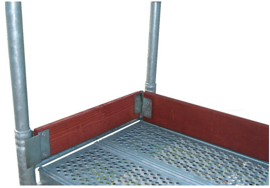
Rys. 4 Sposób mocowania desek burtowych