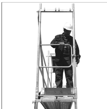
Rys.2. Montaż poręczy poprzecznej