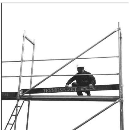
Rys.1. Zakładanie deski burtowej

Deski burtowe zabezpieczające rusztowania od strony zewnętrznej montować na sworzniach ram, ramek L lub ramek górnych (rys.1.). Deski burtowe poprzeczne jednym końcem zakładać na sworznie ramy, a drugim objąć rurę ramy rusztowania lub ramki górnej (rys. 4.).