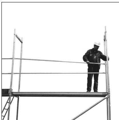
Rys.3. Montaż poręczy